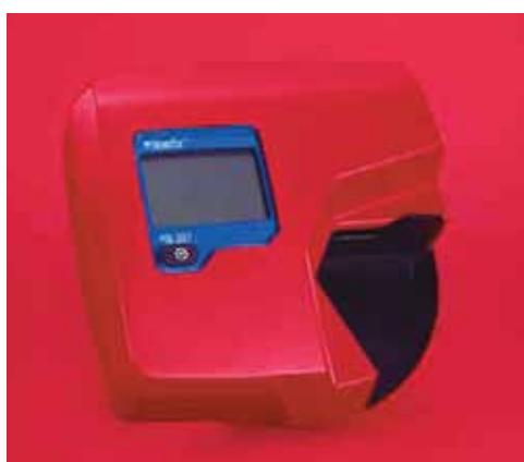
HemoCue® Hb 301 System