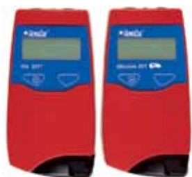
HemoCue® 201 Systems: Hb and Glucose