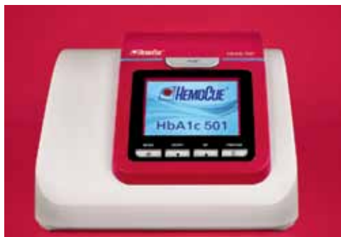
Système HemoCue® HbA1c 501