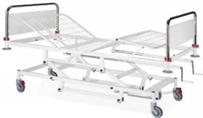
1.101.00 - LIT HOSPITALIER