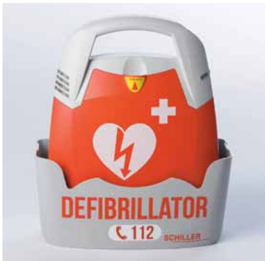
DÉFIBRILLATEUR FRED PA-1