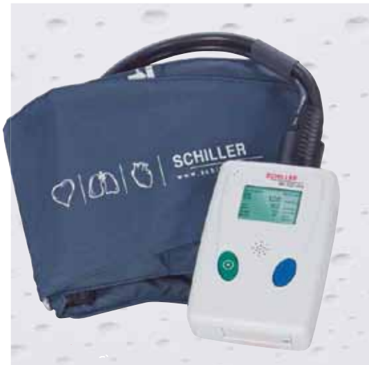
BR-102 - Mesure ambulatoire de la pression artérielle

Les logos, visuels et marques présents dans ce catalogue sont la propriété de leur détenteur respectif.