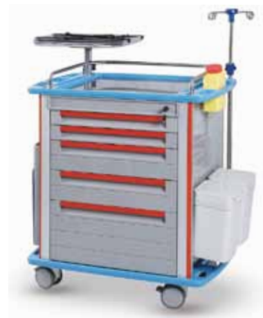
01.6275 - CHARIOT D'URGENCE