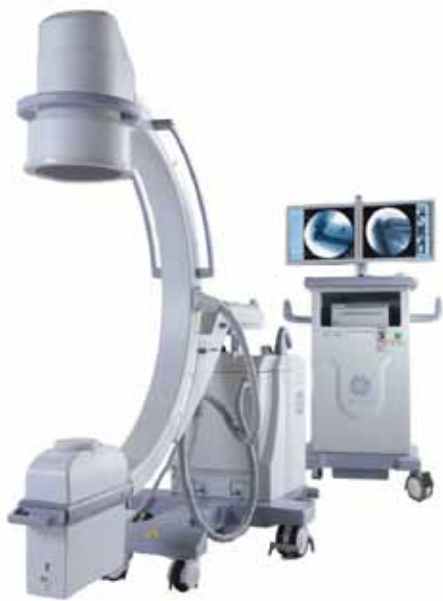
OEC BRIVO ESSENTIAL