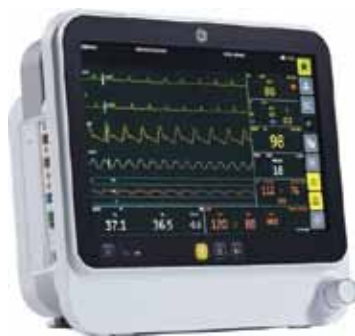
B125 PATIENT MONITOR