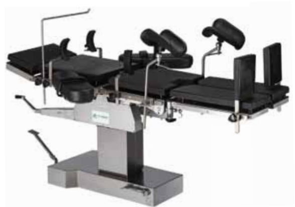
FM300 - TABLE D'OPÉRATION MANUELLE HYDRAULIQUE

Les logos, visuels et marques présents dans ce catalogue sont la propriété de leur détenteur respectif.