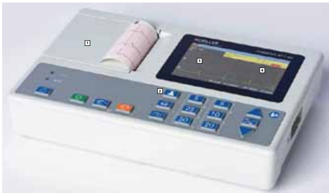
CARDIOVIT AT-1 G2