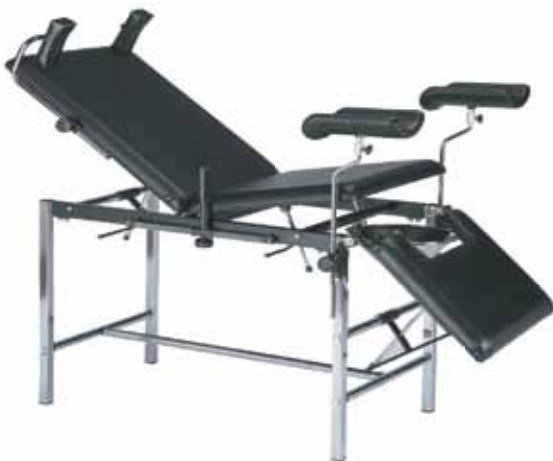
02.359.10 - DIVAN GYNÉCOLOGIQUE