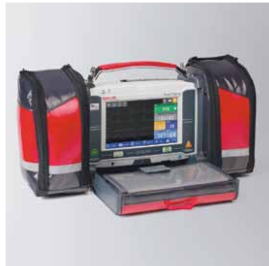
DÉFIBRILLATEUR DEFIGARD TOUCH 7