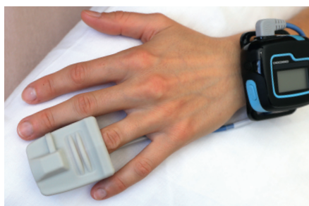
Capteur SpO 2 , attaché pour la nuit

Grâce à l'enregistrement de la respiration dérivé de l'ECG, le medilog®AR est en mesure de détecter d'éventuels épisodes respiratoires pendant le sommeil. Le capteur SpO 2 facultatif, connecté via Bluetooth, permet d'obtenir plus d'informations relatives à la respiration.